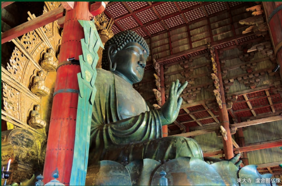
東大寺 盧舎那仏像