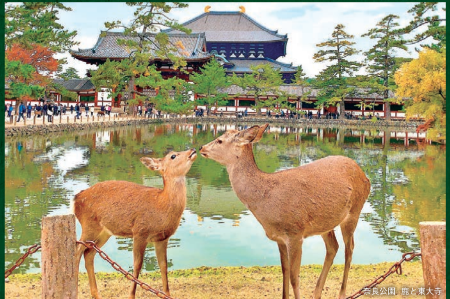
奈良公園 鹿と東大寺